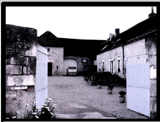
Dans l'enceinte typique du corps de ferme bourguignon.